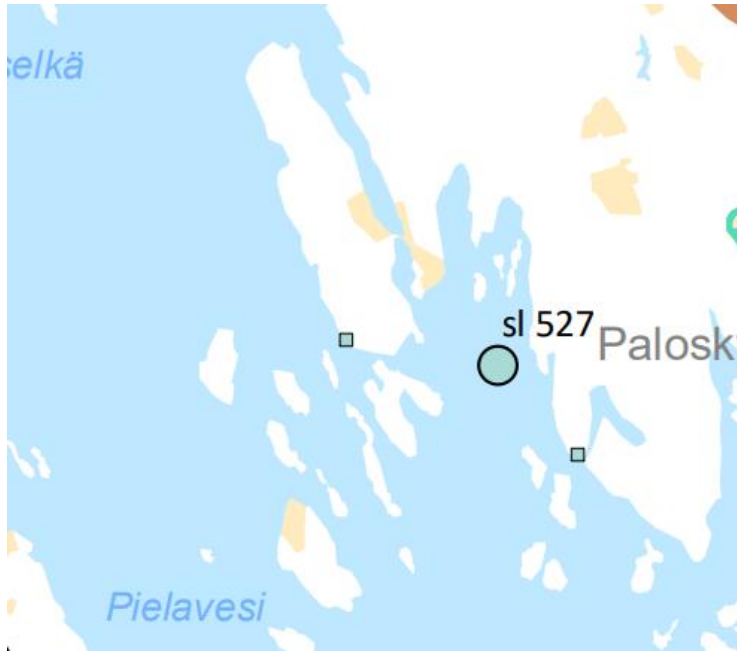
Kuva 3. Ote Pohjois-Savon maakuntakaava 2040 II-vaiheen kaavaehdotuksesta.

Suunnittelualueeseen ei kohdistu aluevarauksia.