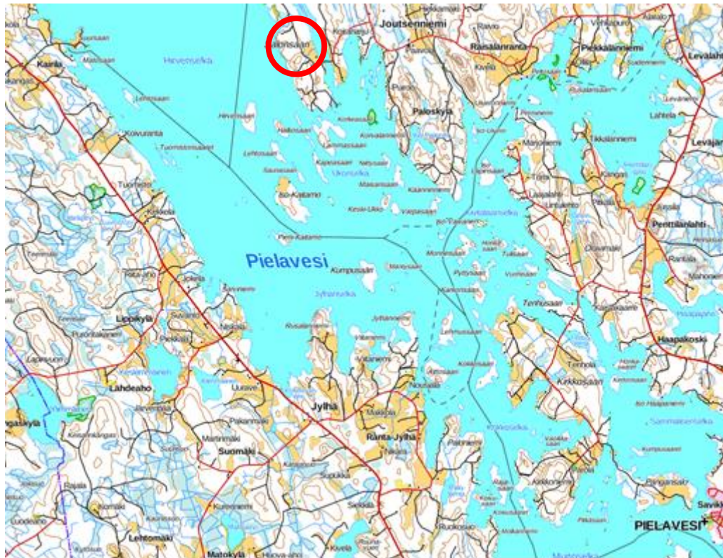
Kuva 1. Suunnittelukohteen sijainti maastokartalla (Paikkatietoikkuna).