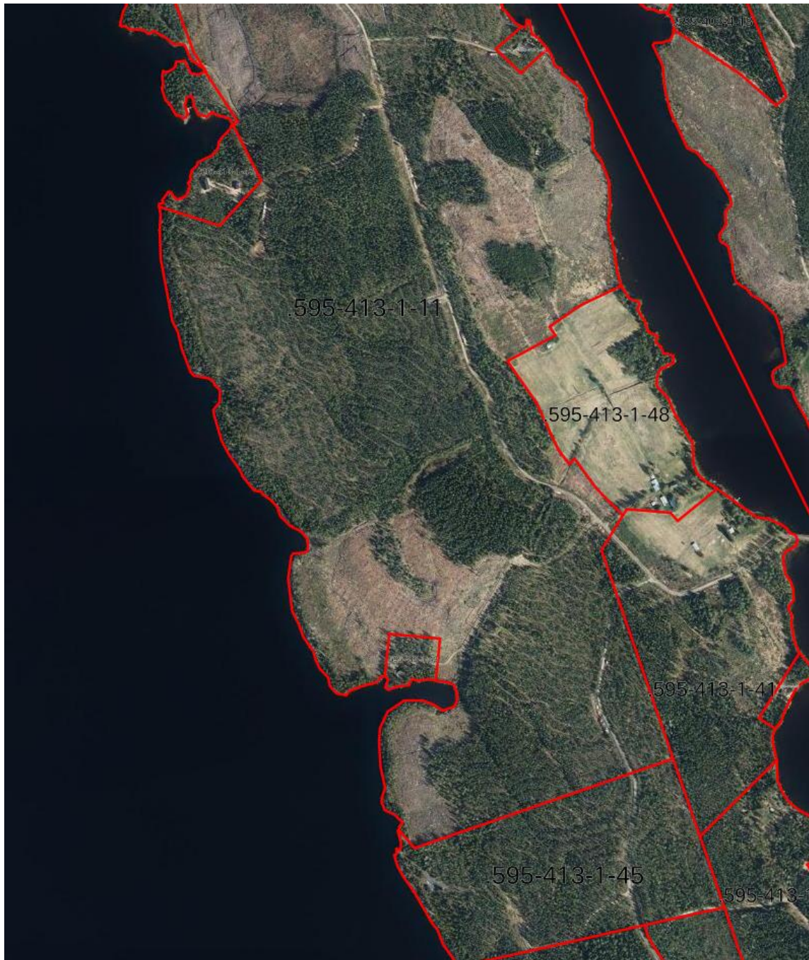
Kuva 4. Ortokuva suunnittelualueesta (Paikkatietoikkuna).