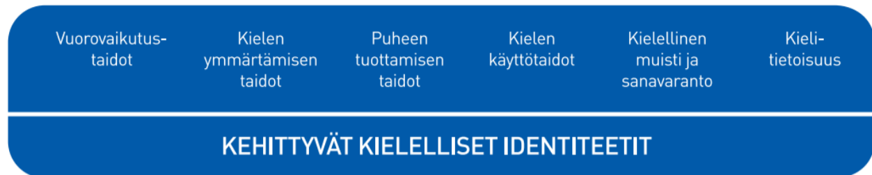
Kuvio 2. Lasten kielen kehityksen keskeiset osa-alueet varhaiskasvatuksessa

huoltajien kanssa. Varhaiskasvatuksessa lapsille annetaan kannustavaa ja johdonmukaista palautetta heidän kielenkäyttö- ja vuorovaikutustaidoistaan.