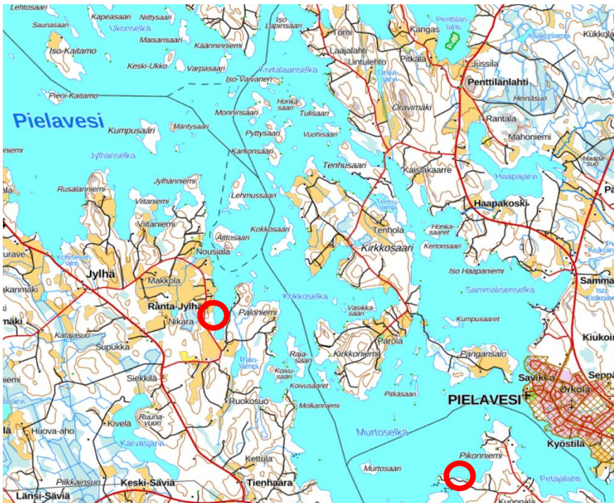
Kuva 1. Suunnittelualueiden sijainnit on merkitty punaisella ympyrällä.

Reinikanlahden rannalla olevasta tilasta 595-403-3-7 on tarkoitus selvittää yleiskaavan muutoksella rakennuspaikan siirtoa Säviänniemeen Sarvikkaanlahdelle tilalle 595-422-2-50.