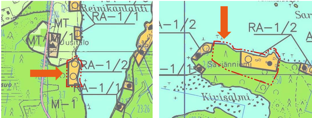
Kuva 2. Muutosalueiden likimääräiset rajaukset punaisella pistekatkoviivalla.

Rantaosayleiskaavan muutoksen tavoitteena on siirtää yhtä lomarakennuspaikkaa maanomistajan toiveesta Reinikanlahdelta Säviänniemeeseen Sarvikkaanlahdelle. Samalla korjataan merkinnät tilojen 595-422-2-69 ja 595-422-2-2 osalta; kummallakin yksi oleva RA-paikka.